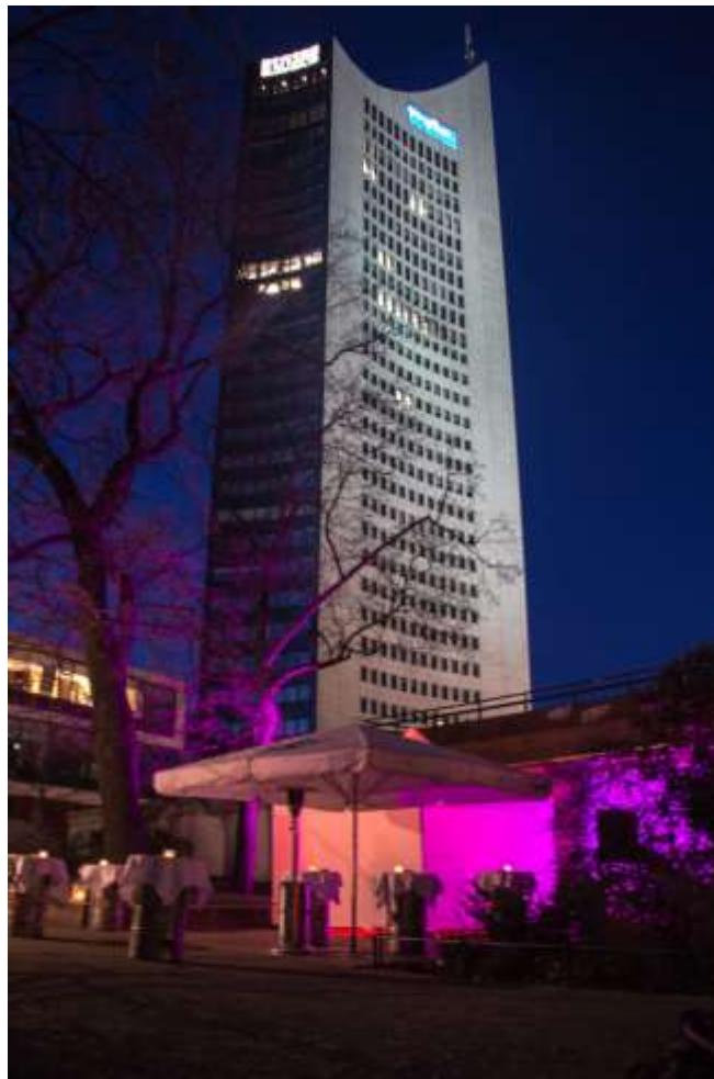
Eingangsbereich zum Oberkeller