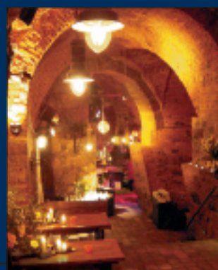
DER OBERKELLER mit seinen Tonnengewölben