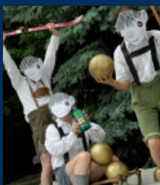
THEATER AUS DEM HUT Animationstheater